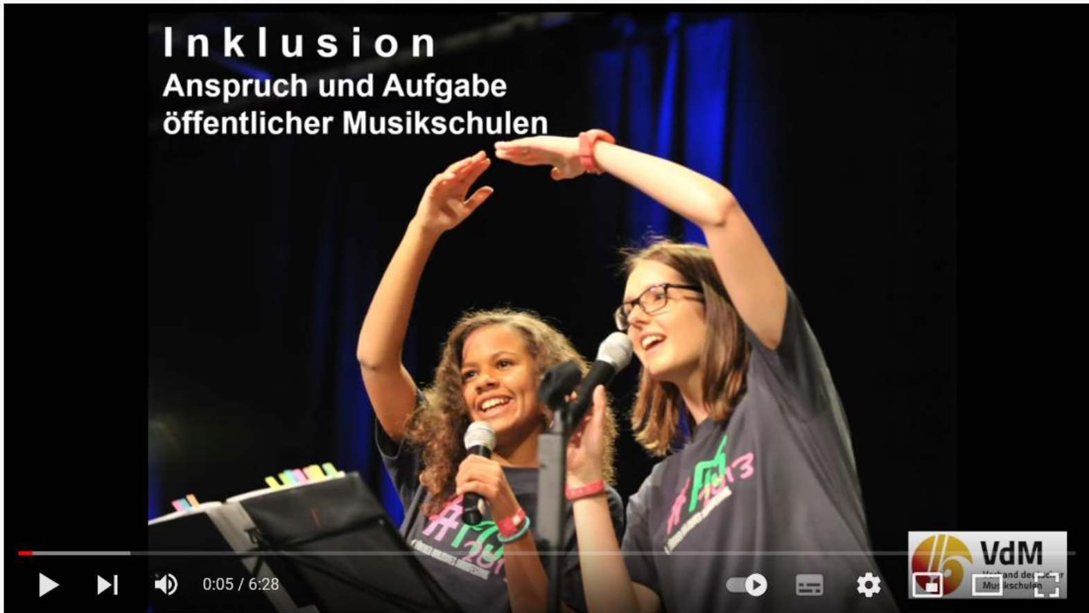
Teilhabe Anspruch und Aufgabe öffentlicher Musikschulen